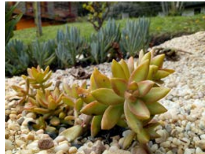
Jardín ornamental Xerófilo Tenjo Cundinamarca, 2020.