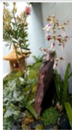
Jardín japonés con fuente solar. Tenjo - Cundinamarca, 2019.