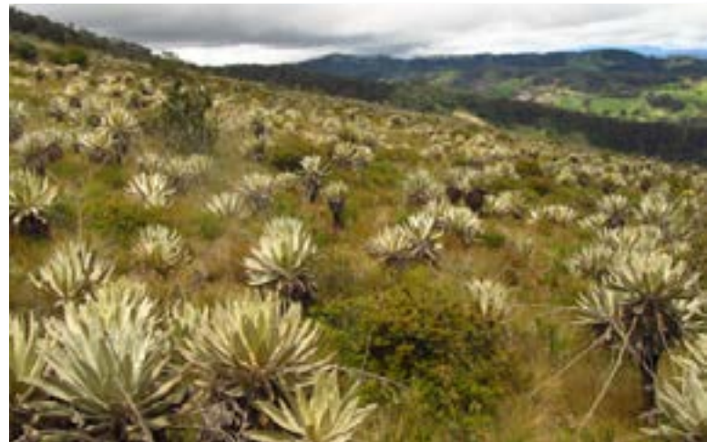
Análisis de coberturas del paisaje.