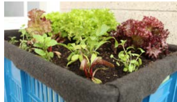
Contenedores modulares móviles y fijos para edificaciones y espacio público.