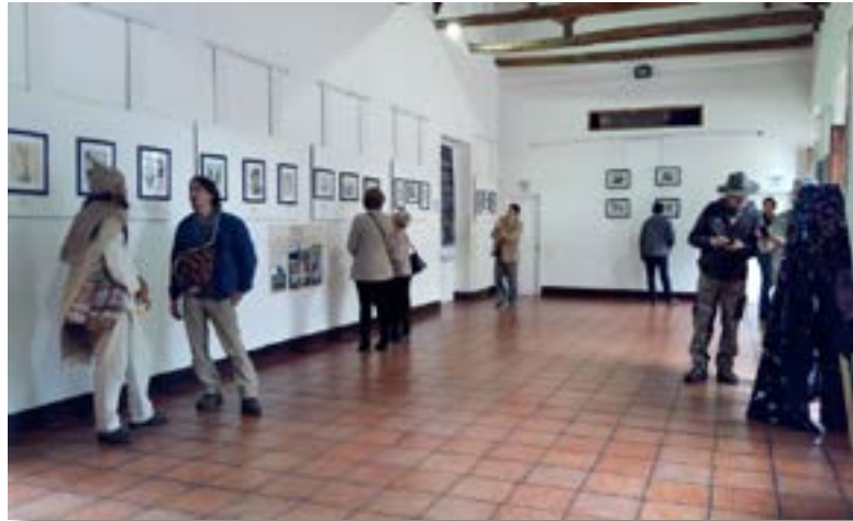
Caracterización de riqueza florística, Ecoparque Tygüa Magüe, 2017. Exposición 60 ejemplares Casa de la Cultura, 2019. Tabio - Cundinamarca.