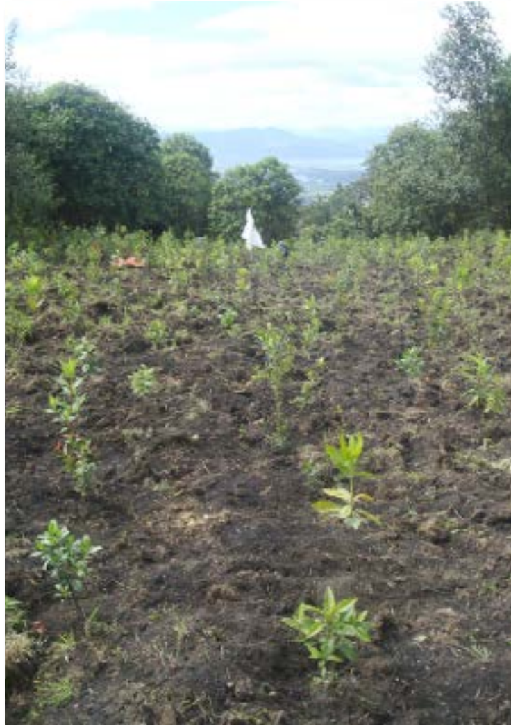
Siembra de más de 200 árboles nativos. Guasca - Cundinamarca, 2019.