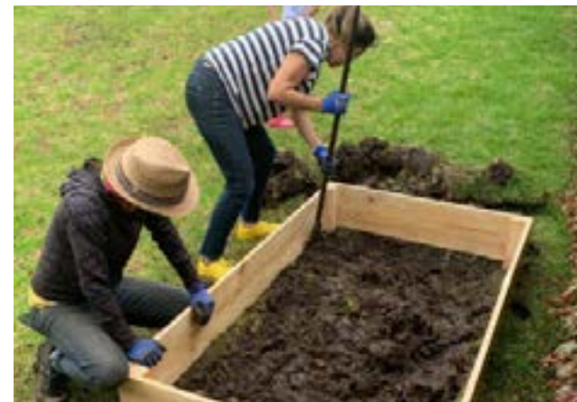
Taller e implementación de huerta familiar. Chía - Cundinamarca, 2020.