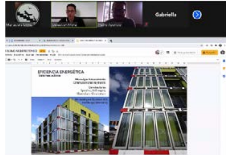
27 asistentes al Taller Botánica y Metabolismo arquitectónico. Universidad de los Andes, 2020.