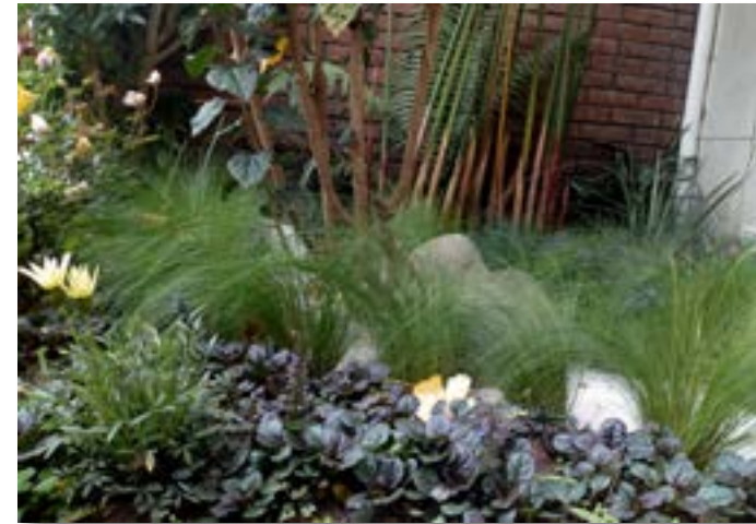
Jardín ornamental tipo naturalista Bogotá D.C., 2019.