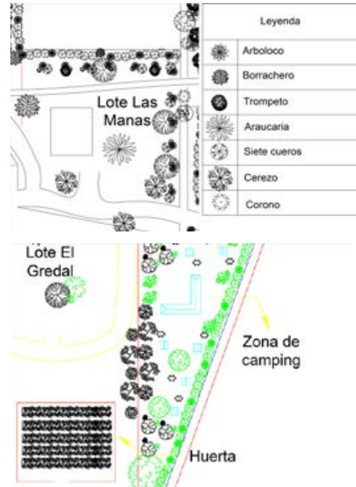
Proyecto de restauración de suelo e implementación de sistemas silvopastoril en lote de 3,5 Ha. Se proyecta la siembra de 2000 árboles.