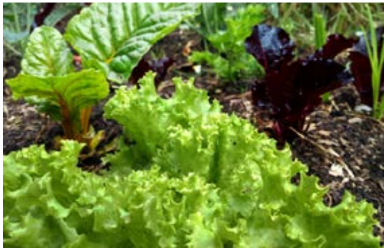
Manejo de cultivos, alelopatía y control de plagas.