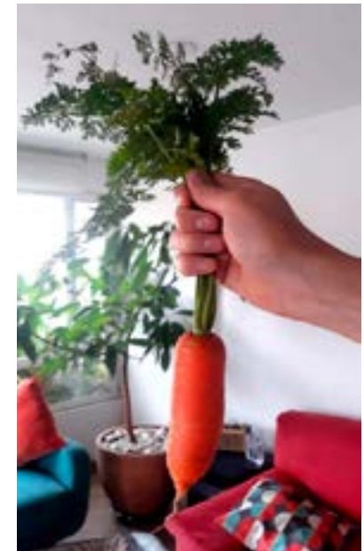
Implementación y cosecha en huertas urbanas en Bogotá D.C