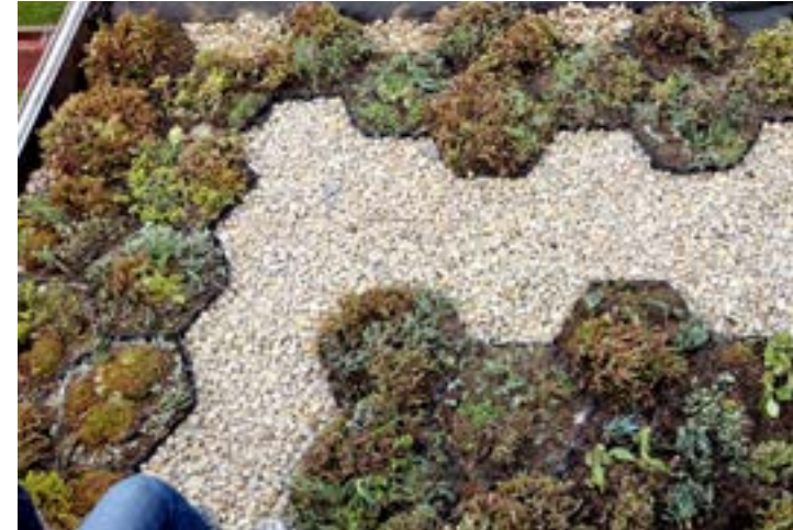
Terrazas, techos y pisos de edificaciones y espacio público.