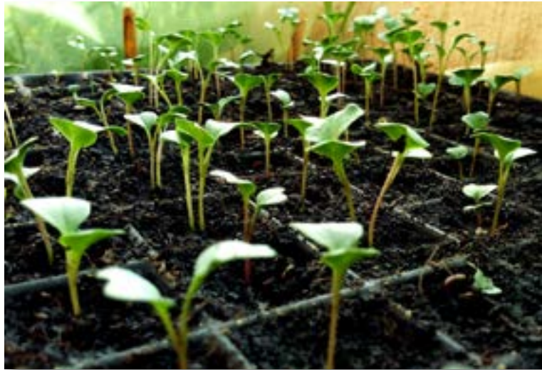
Sustratos, germinación y plantulación.