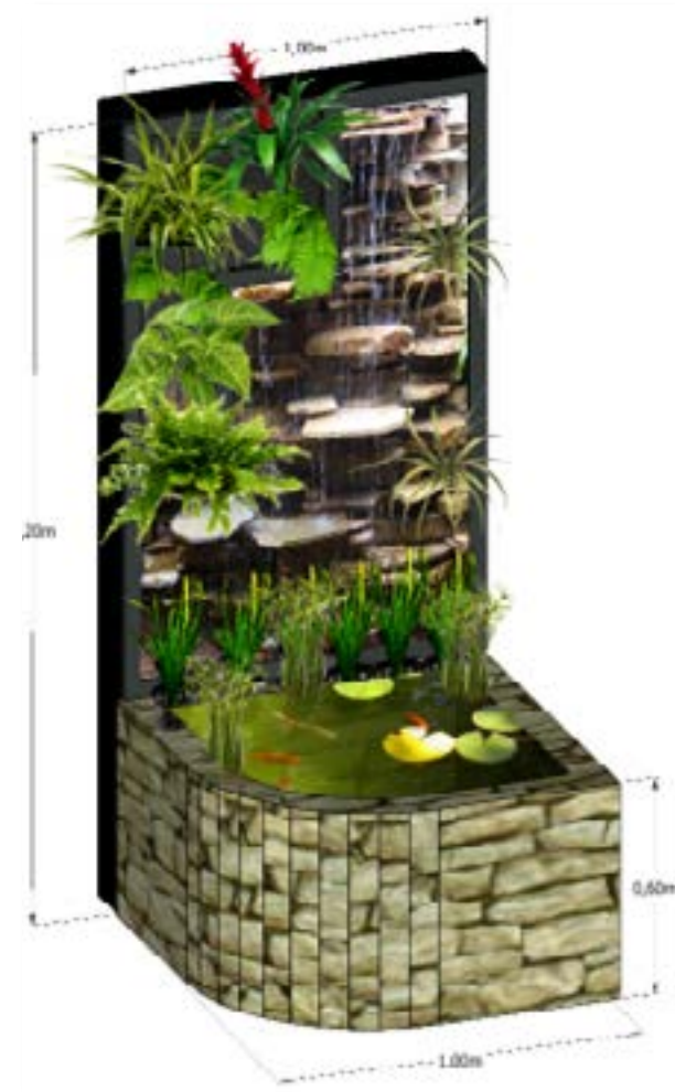
Diseño de Fuente en Muro Verde con estanque Koi. Bogotá D.C., 2020.