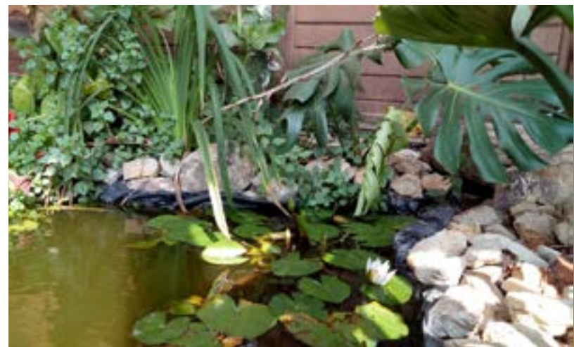
Estanque con fuente solar. Tenjo - Cundinamarca, 2019.