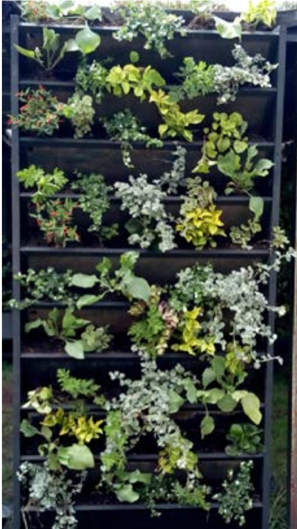
Estructuras ancladas y flotantes en muros exteriores.